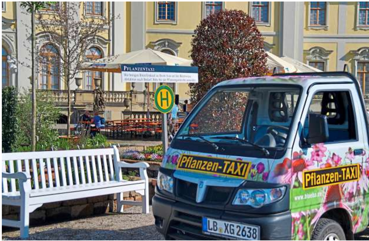
Das Pflanzen-Taxi bringt die Einkäufe zu den Parkplätzen und auch an den Bahnhof.

Auf diese Weise können die Besucherinnen und Besucher auch die Parkplätze außerhalb der Innenstadt nutzen. Am einfachsten ist es, hierzu dem Parkleitsystem der Stadt Ludwigsburg zu folgen. Praktisch: Mit der App Stadtnavi Ludwigsburg können sich Besucher auch bereits vor