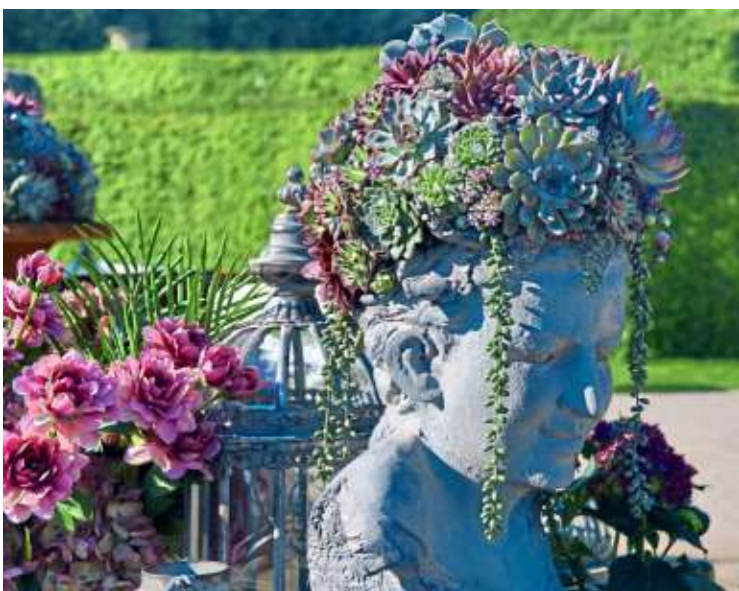
Natur- und Pflanzeninteressierte von nah und fern treffen sich jedes Jahr bei den Barocken Gartentagen im Blüba.