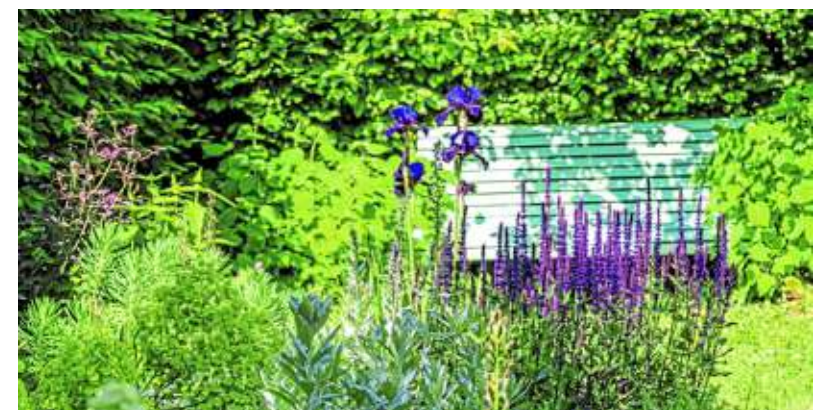
Der Blüten-Salbei ‚Caradonna‘, hier im Duett mit einer gleichfarbigen Schwertlilie, ist ein wertvoller Nektarlieferant für Bienen und Hummeln und steht am liebsten in voller Sonne.

Die Blattstrukturen, die Wurzeln und die Wuchsform, ja sogar die Blattfarbe haben sich der Hitze ange-